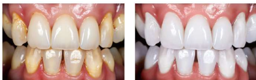
Before ————— \ After