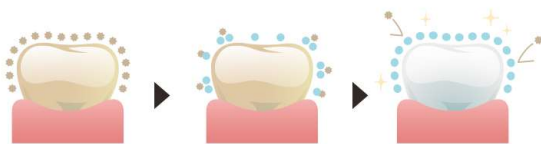
ホワイトニングの過程

ホワイトニングは、歯の表面を削ったり溶かしたりはしません。着色物質を分解するホワイトニング剤(過酸化尿素)によって歯の色調を明るくします。